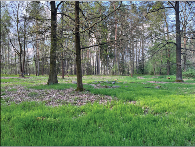
9. Mezi velkými duby se rýsuje kamenný věnec mohyly takzvaného "Knižcího hrobu" (č. XXIV), jak jej nazval R. Hiersche. Je to jediný hrob, který lze mezi stávajícím porostem dobře identifikovat.