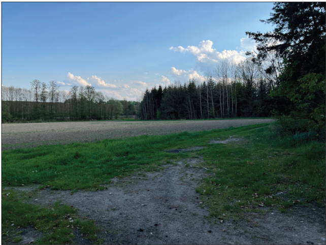
7. Další možností, jak se k pohřebišti dostat, je směrem od jihovýchodu. Vede k němu cesta kolem pole. Když se v první zatáčce zahne do prava, lze na pohřebiště dojít zarostlou cestu z jihu. V dálce se třpytí hladina Mlýnského rybníku.