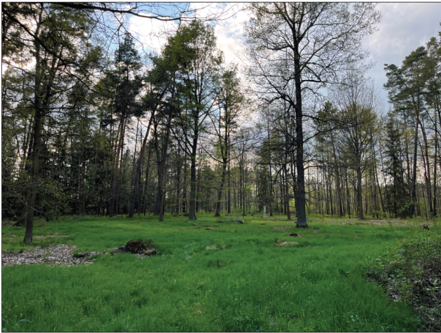
8. Na konci cesty se návštěvníkovi otevře pohled na celou plochu z pravého spodního rohu. Uprostřed dominuje největší dub (Quercus robur) celého pohřebiště, vysazený pravděpodobně J. G. Hierschem. Po jalovcích (Juniperus communis) vysázených též J. G. Hierschem dnes není ani památky. Zbylo snad jen několik ztrouchnivělých pařezů, o kterých se můžeme domnívat, že jimi byly.