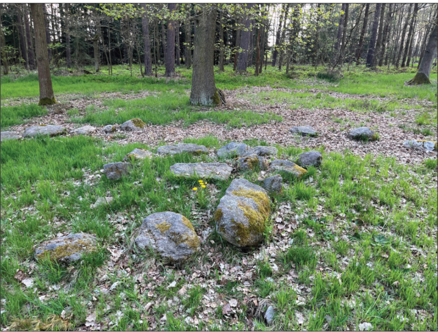
12. Od tohoto hrobu (č. XXIV) na západ byl J. G. Hierschem zasazen dub letní (Quercus robur).