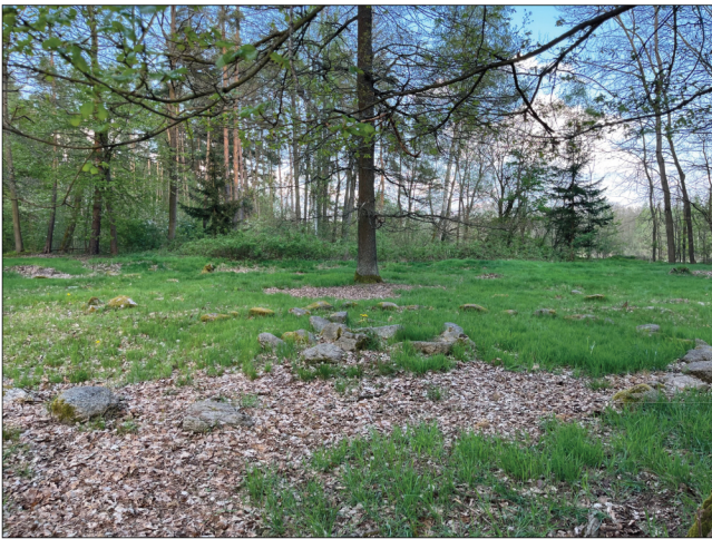
11. Za hrobem č. XXIV směrem na východ lze spatřit onen největší dub (Quercus robur) na pohřebišti a za ním, dále na východ, se dle archeologických výzkumů našly zbytky pravěkého sídliště.