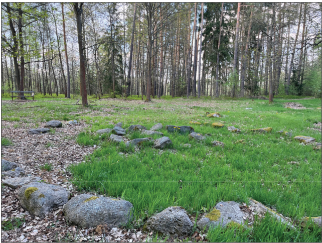
10. Svým uspořádáním je to nejhonosněji vybavený hrob na žirovickém pohřebišti (Plesl, 1969). Ve středu mohyly byla postavena čtyřhranná kamenná komora, stále ještě dobře patrná.